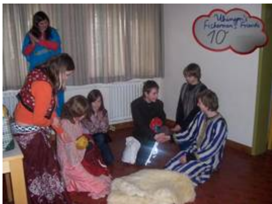
Das praxisnahe Lernen in der Gruppe nimmt Alltagssituationen in den Blick.

TRAINEE FOR SCHOOL ist eine Schulungseinheit, die es in unterschiedlichen Formen in ganz Württemberg gibt. In mehreren Treffen werden Themen behandelt, die dir bei deinem Engagement in der Schule (Hausaufgabenbetreuer, Klassenpate, ...) und in deinen privaten Gruppen helfen.