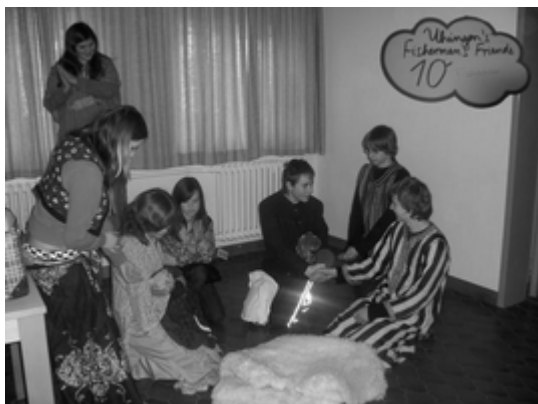
Das praxisnahe Lernen in der Gruppe nimmt Alltagssituationen in den Blick.

TRAINEE FOR SCHOOL ist eine Schulungseinheit, die es in unterschiedlichen Formen in ganz Württemberg gibt. In mehreren Treffen werden Themen behandelt, die dir bei deinem Engagement in der Schule (Hausaufgabenbetreuer, Klassenpate, ...) und in deinen privaten Gruppen helfen.