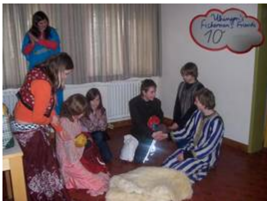
Das praxisnahe Lernen in der Gruppe nimmt Alltagssituationen in den Blick.

TRAINEE FOR SCHOOL ist eine Schulungseinheit, die es in unterschiedlichen Formen in ganz Württemberg gibt. In mehreren Treffen werden Themen behandelt, die dir bei deinem Engagement in der Schule (Hausaufgabenbetreuer, Klassenpate, ...) und in deinen privaten Gruppen helfen.